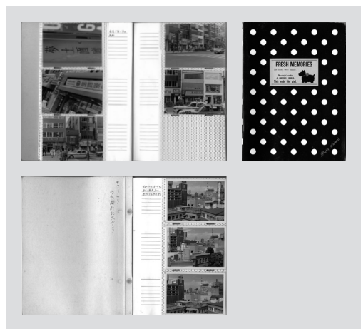
図4 画廊に関する記録写真