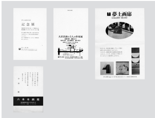
図1 夢土画廊の展覧会案内葉書