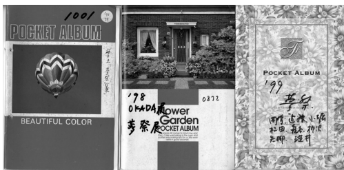
図5 「夢祭」の写真アルバム