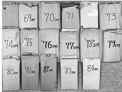
図2 展覧会案内葉書の入った封筒