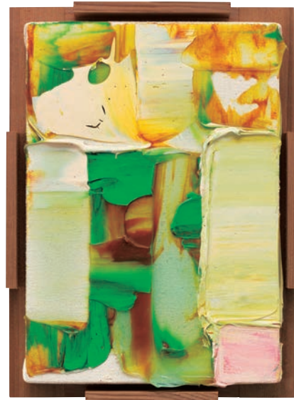
岡崎乾二郎《Pittura Senza Disegno / 風景のなかの聖母子 / Altarpiece》 2020年、アクリリック・キャンバス、25.2×18.4×3.0cm、作家蔵 © Kenjiro Okazaki

ゼロサムネールは歴史上のさまざまな絵画や物語と呼応しており、「風景のなかの聖母子」もジョルジョーネが故郷の聖堂に遺した「カステルフランコ祭壇画」に由来する。ゼロサムネールは作家の最大規模のシリーズだけに、これまで幾度も作品を目にしてきたが、今回の展示ほど情感を揺すぶられたことはないと白状する。恐らく、環境を含め「私」が変わったのだ。ウイルスという不可視の存在を絶えず意識する日々の中で、感覚が内在化し、鋭敏になった。目に見えない何か「在る」こと、それが世界を確実に侵食できること、小ささは持てる力と無関係なことを、私はもはや疑わない。視覚と認識の落差を恐れずに受け止める知覚の広がり、より柔軟な絵画受容をもたら