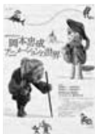
造形作品でみる岡本忠成 アニメーションの世界 2p