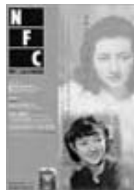
□2004年9月号 映画女優 高峰秀子 (1) 6p