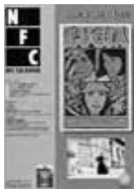
□2004年4月号 キューバ映画への旅 4p