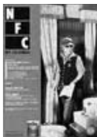
□2004年12月-2005年2月号 特集・逝ける映画人を偲んで 2002-2003 6p