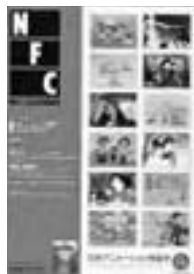
□2004年7-8月号 日本アニメーション映画史 8p