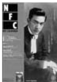
□2005年1月特別号 シネマの冒険 闇と音楽 アメリカ 無声映画傑作選 4p