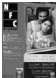
□2004年5-6月号 アジア映画―“豊穣と多様” 6p