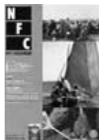
□2005年3月号 フィルムは記録する2005 6p