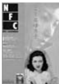
□2004年10-11月号 映画女優 高峰秀子 (2) 6p