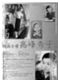
映画女優 高峰秀子展 2p